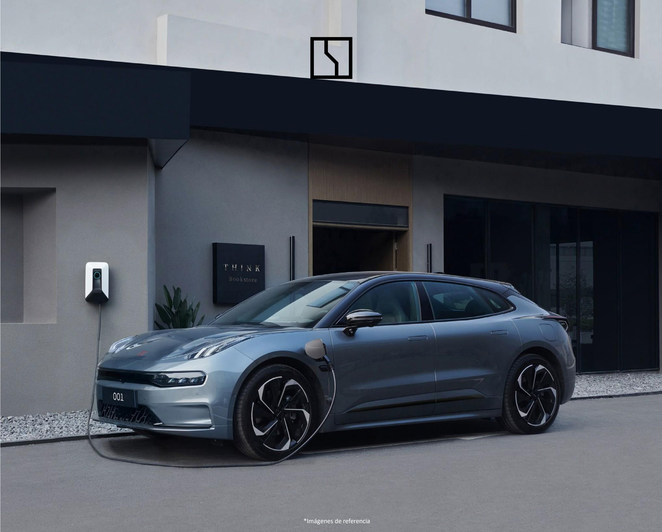
*Imágenes de referencia