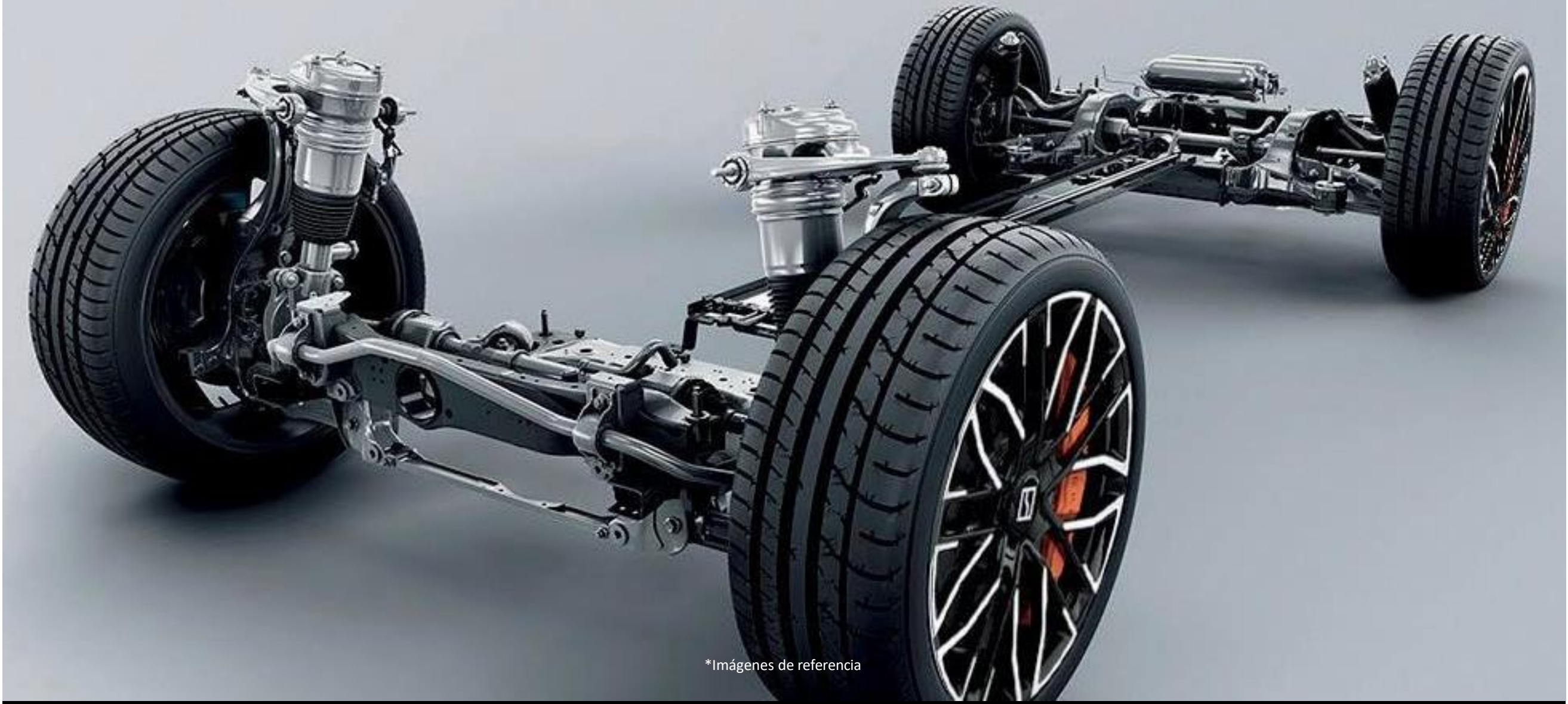
*Imágenes de referencia