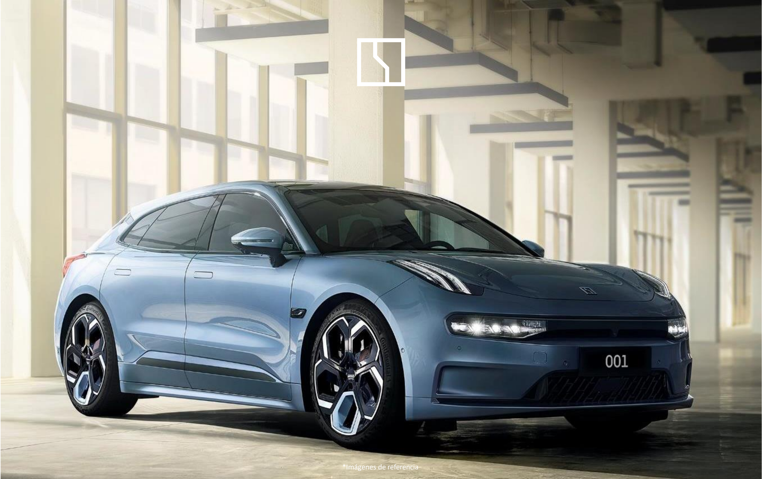
*Imágenes de referencia