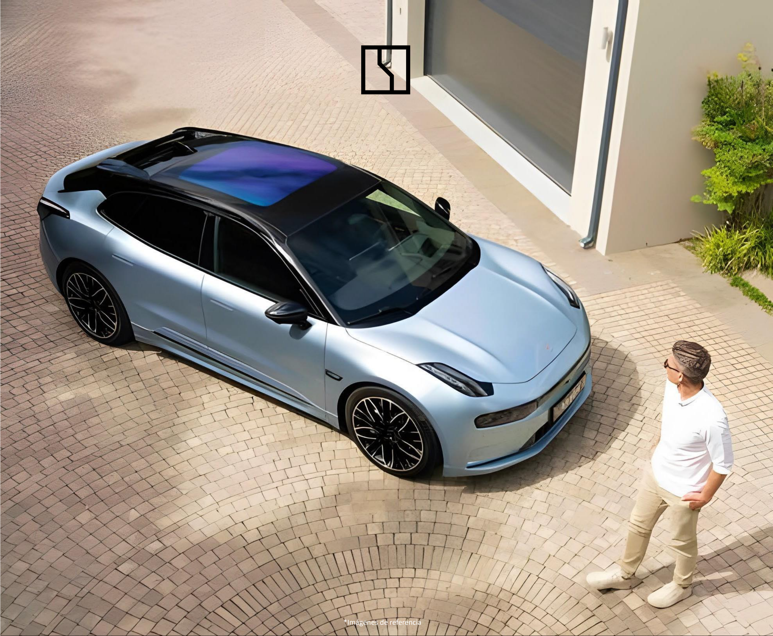
*Imágenes de referencia