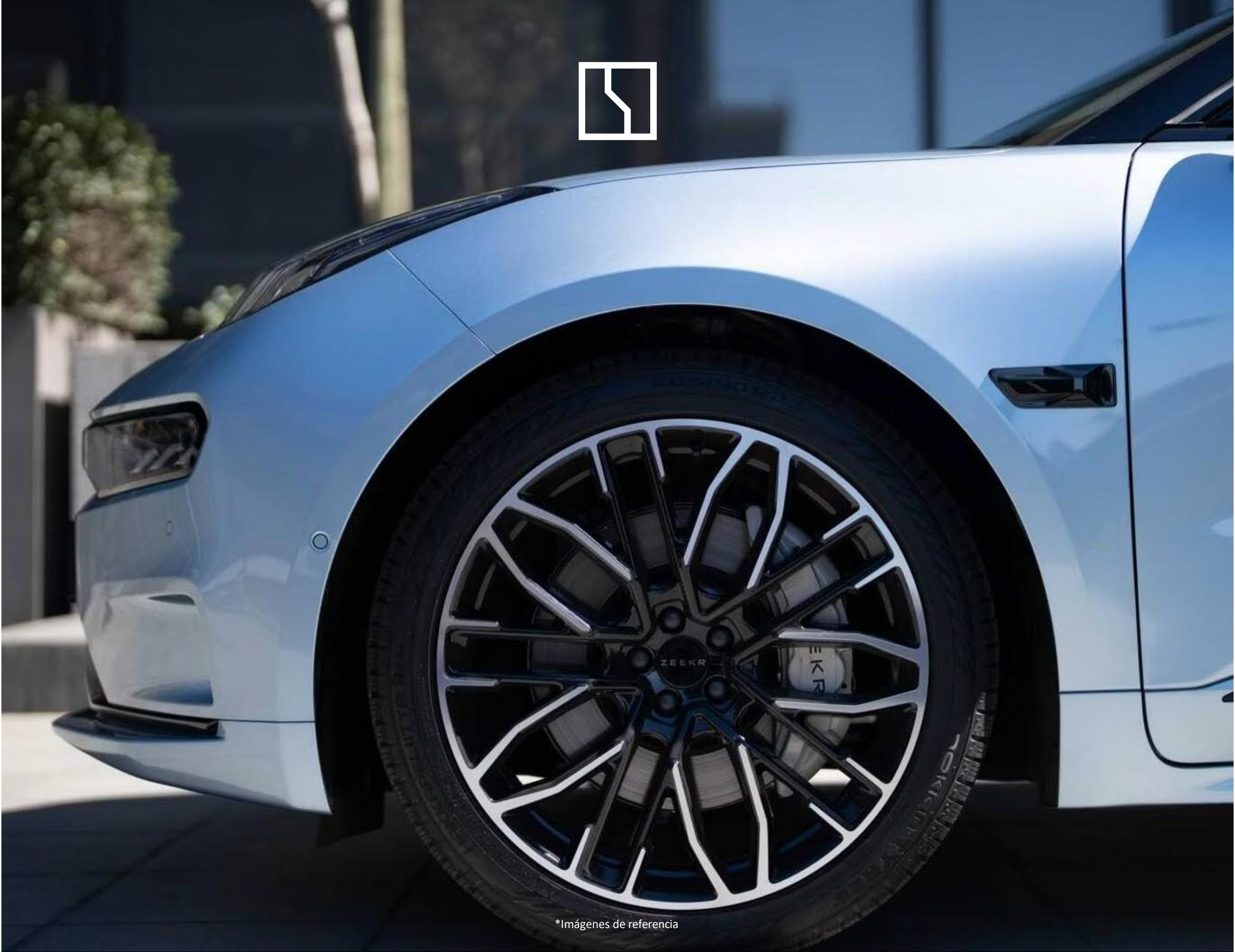
*Imágenes de referencia